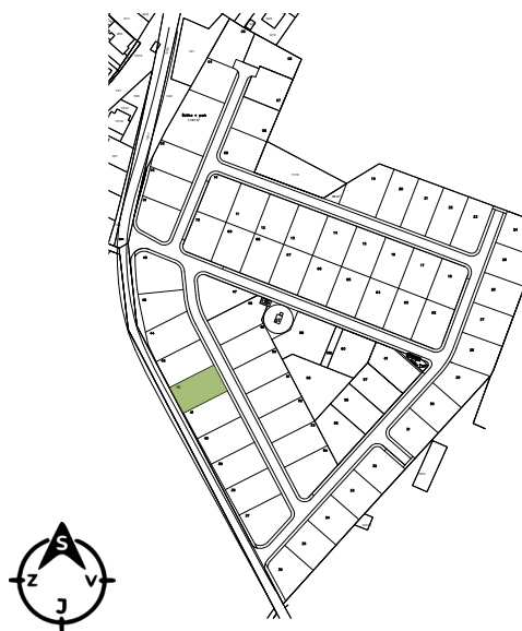
DETAIL POZEMOK + DOM